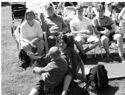
Nogle billeder fra Åsebakken Valfart den 25. maj 2008

Fra september 2008 fejres ikke mere menighedsmesse lørdag aften på Ledreborg, men søndag aften kl. 17:00. Vi håber, det er en mere praktisk tidspunkt for de fleste. Den næste menighedsmesse i Ledreborg Slotskirke bliver altså søndag, den 7. september kl. 17:00 . Der er ingen menighedsmesse på Ledreborg i juli og august.